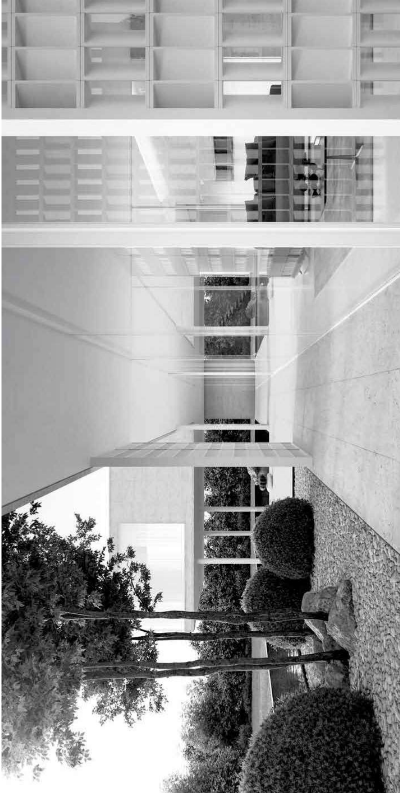
A VERSATILE HOUSE