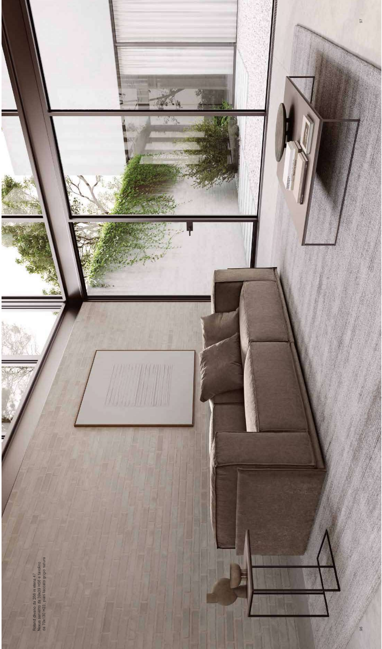
Roland divano da 295 in elena 47 Nexus servizio da 35x39 145 e tavolino da 70x130 142, piani laccato grigio natura